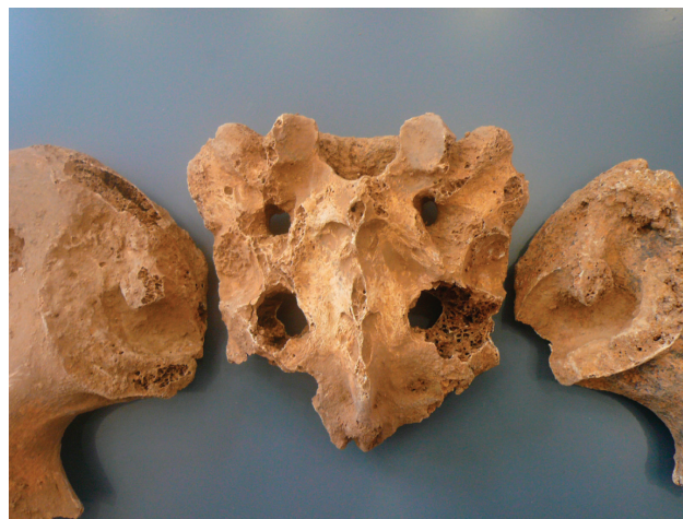
Εικόνα 4. Ιερό οστό, ιερολαγόνια άρθρωση άμφω, τάφος 3.

Στο σύνολο, όλοι οι σκελετοί δεν εμφανίζουν τέτοια παθολογικά ευρήματα ασθενειών που θα μπορούσαν να