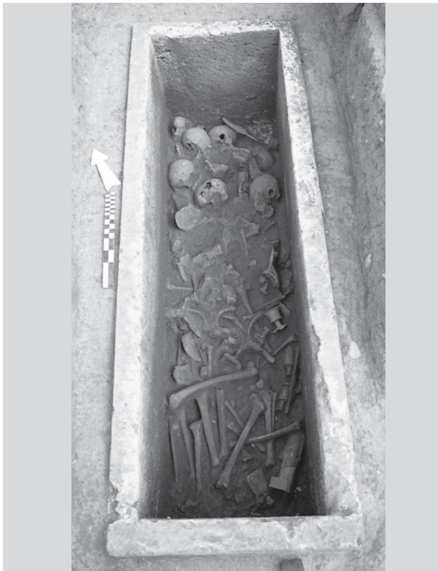
Εικόνα 2. Πολλαπλή ταφή, σαρκοφάγος.