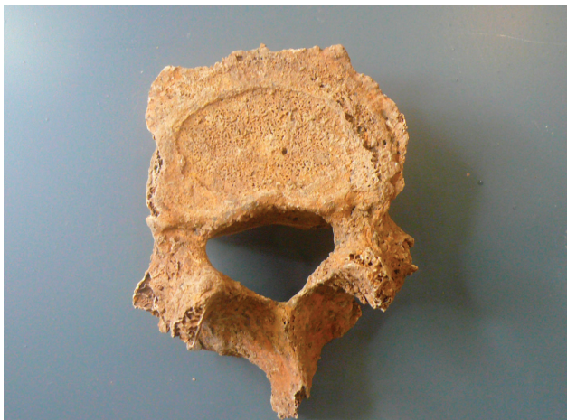
Εικόνα 5. Εκφυλιστικές αλλοιώσεις σε σώμα οσφυϊκού σπονδύλου.

οδηγήσουν στον θάνατο. Έτσι, η αιτία θανάτου δεν είναι ακόμη αναγνωρίσιμη.