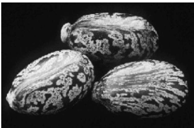
Εικόνα 2. Σπόροι του φυτού ρετσινολαδιά, απ' όπου προέρχεται η ρικίνη.

με δημιουργία πανικού, αναστάτωσης και εξάντλησης του δυναμικού και των φορέων υγειονομικής φροντίδας των πολιτών. Ένας τέτοιος παράγοντας θα πρέπει να είναι εξαιρετικά τοξικός και θανατηφόρος, να μπορεί να παραχθεί εύκολα και φθηνά σε μεγάλες ποσότητες, να είναι σταθερός σε μορφή αερολύματος και να είναι δυνατόν να μεταδοθεί αερογενώς (1–5 μm). Επίσης, να είναι μεταδοτικός από άνθρωπο σε άνθρωπο και να μην υπάρχει διαθέσιμη γι' αυτόν θεραπεία ή εμβόλιο.