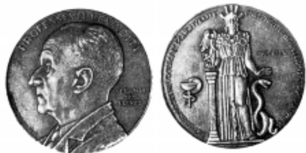
Εικόνα 5. Τιμητικό μετάλλιο προς τιμή του Κ. Λεβαδίτη για την προσφορά του στην ιατρική επιστήμη (1945).

Σύμφωνα με τον ιστορικό John Paul, «είναι ατυχία το ότι ο Λεβαδίτης δεν έζησε δύο ακόμα χρόνια, για να γίνει μάρτυρας της συντριβής της πολιομυελίτιδας από τον επιστημονικό κλάδο, στον οποίο για πολύ καιρό υπήρξε πρωτοπόρος, την Ανοσολογία. Έζησε όμως αρκετά για να δει το έργο που επιτέλεσε μαζί με τους Kling και Lerpine να δικαιώνεται, γεγονός που δεν ήταν διόλου μικρός θρίαμβος». 6